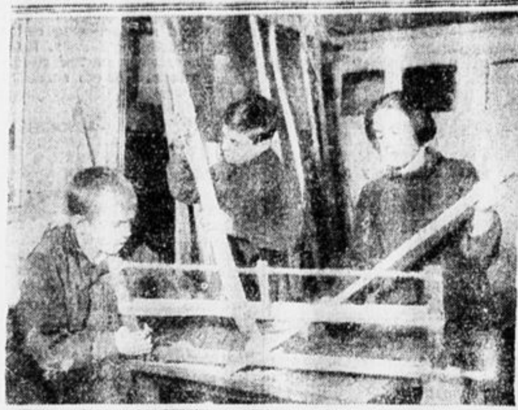
Живо дело закипело

Для группы его лет он порядочно отстал, но его необыкновенная энергия и желание помогут ему,—закончил вожатый.