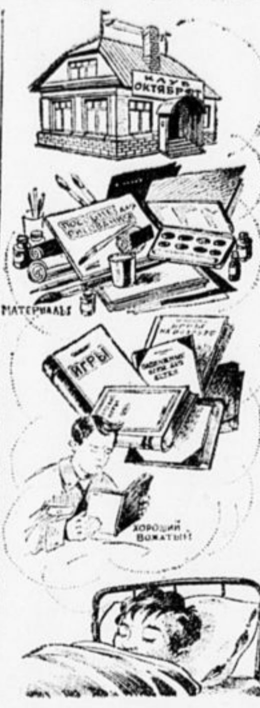
Что снится октябрюч

Вожатый, говорят, очень доволен. Это интересней, чем ворону с места на место перекладывать. Ворона-то мертвая была, а октябрюча — живые. Говорят, что они недовольны. Вот капризники!