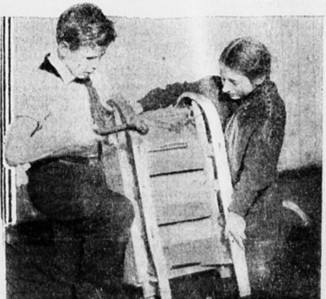
...и поспело в полчаса.

— Э, брат, не сразу Москва строилась. Путем долгой и упорной работы мы добились этого. Интересные эпизоды я тебе могу рассказать.